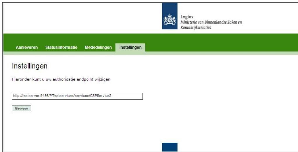
Figuur 7: autorisatie-endpoint aanpassen

Het tabblad 'instellingen' biedt u de mogelijkheid het AuSP Endpoint in te vullen of te wijzigen.