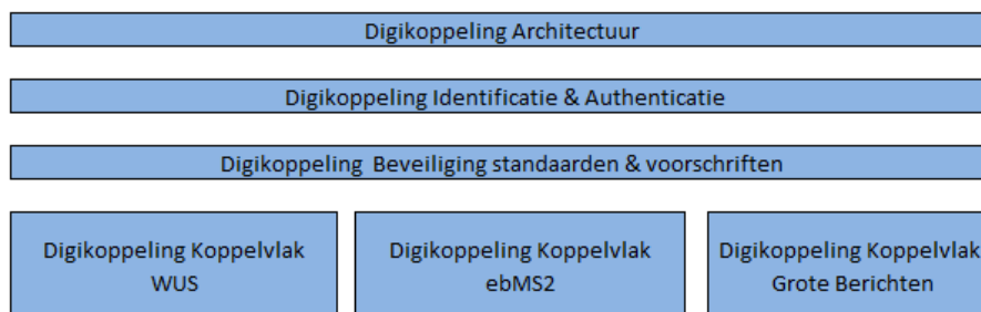
Figuur 1: Onderdelen digikoppeling specificatie

De onderstaande figuur geeft de verschillende onderdelen van de digikoppeling standaard weer: