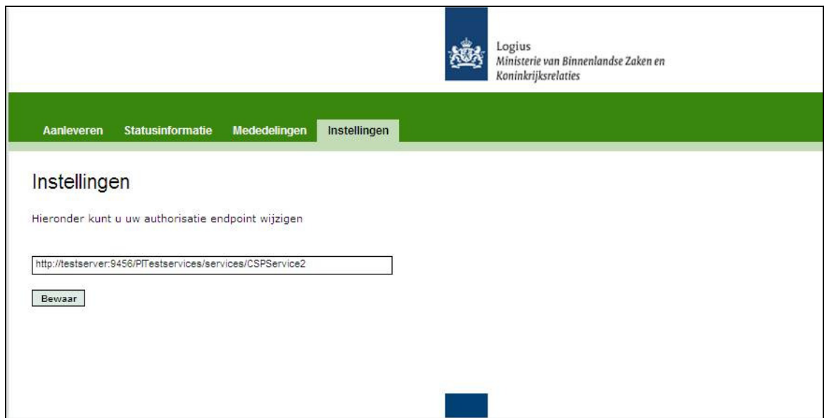
Figuur 7: autorisatie-endpoint aanpassen

Het tabblad 'instellingen' biedt u de mogelijkheid het AuSP Endpoint in te vullen of te wijzigen.